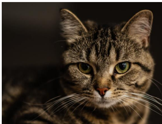
Figura 2: Gato rajado (HELVETICA, 10 PT, centralizado, espaçamento: 12 pt antes, 6 pt depois; entre linhas simples, cor cinza)

(HELVETICA, 10 PT, centralizado, espaçamento: 6 pt antes, 12 pt depois; entre linhas simples, cor cinza)