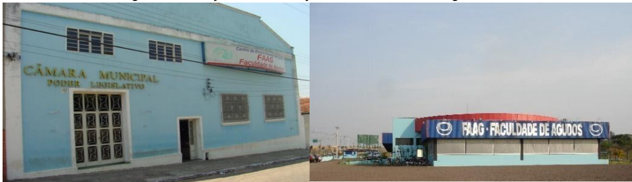
(a) 1ª Sede