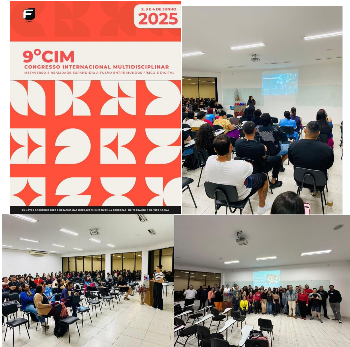
Figura 10. 9º CIM - Congresso Internacional Multidisciplinar