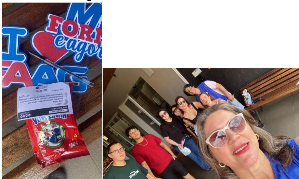
Figura 7. Acolhida alunos Enade 2025

A Faculdade de Agudos realizou também uma acolhida dos alunos no dia da Prova do Enade, com distribuição de um Kit para incentivo e engajamento dos alunos