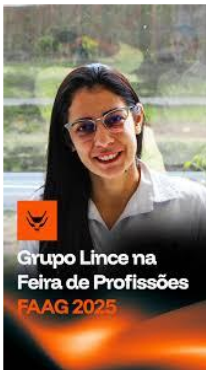
Figura 12. Feira de Profissões