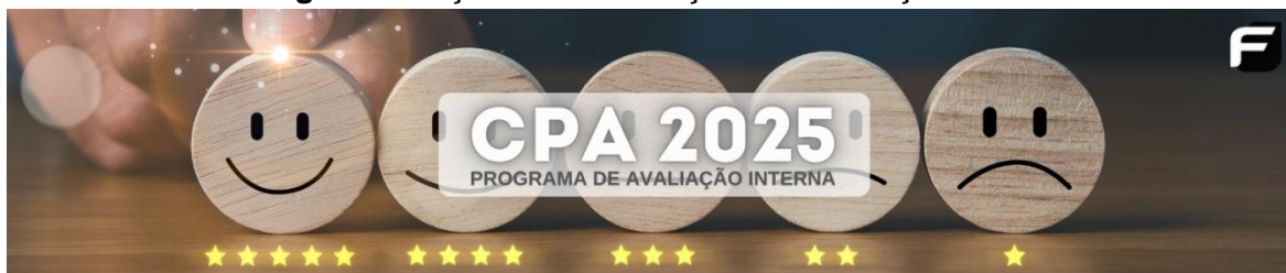
Figura 4. Peça de sensibilização Autoavaliação 2025