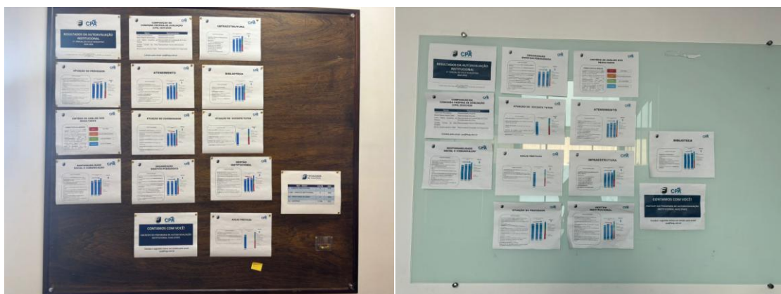
Figura 6. Quadro CPA. Divulgação dos resultados da Avaliação

A CPA também realizar a divulgação através de Murais na FAAG, sendo um Mural no corredor dos alunos, um Mural na Sala dos Professores e Mural na Sala da CPA, para que todos possam ter acesso às informações da Avaliação Institucional (Figura 6).