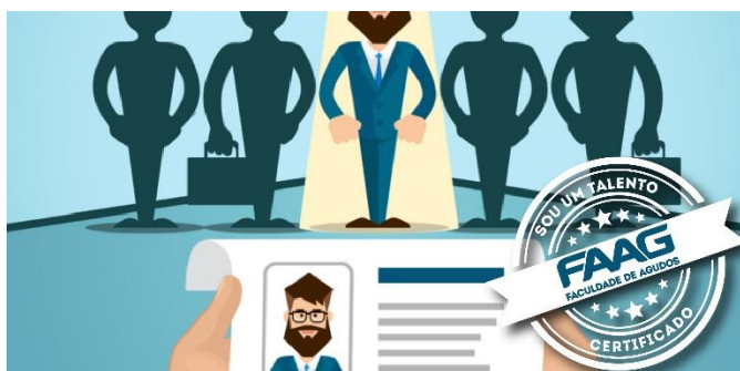
Figura 04. Banner de divulgação do Banco de Talento FAAG

O desenvolvimento do Banco de Talentos FAAG tem por premissa esse importante aspecto direcionador de nossas atividades na instituição: empregabilidade . Nesse sentido, são realizadas parcerias regionais com empresas, visando à inserção de nossos (as) alunos (as) no mercado de trabalho, seja em uma primeira oportunidade de emprego, seja recolocação profissional, seja estágio.