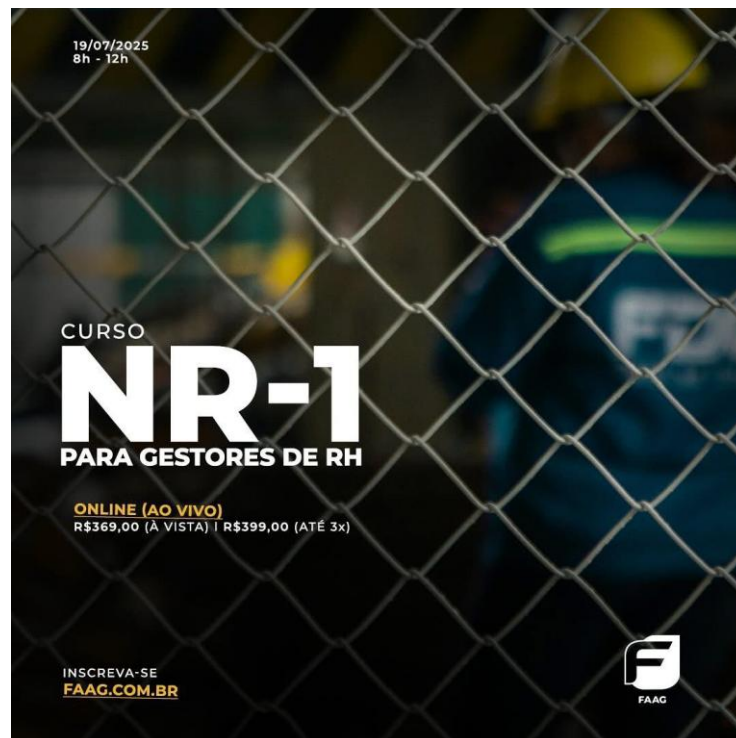
Figura 8. Divulgação de Cursos Profissionalizantes.