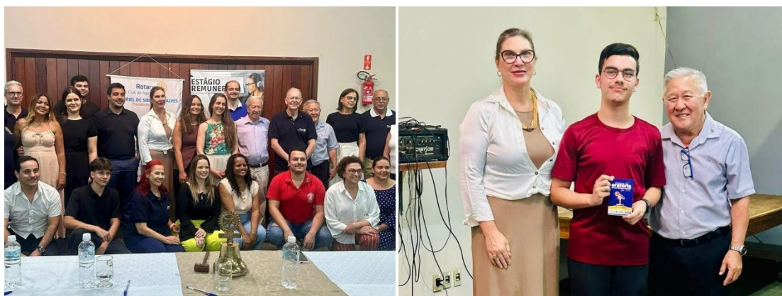
Figura 11. Participação da FAAG no Concurso de Oratória