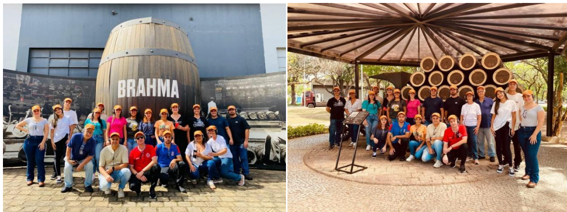
Figura 13. Visita a AMBEV - Agudos